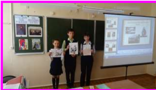
Заседание актива клуба «Парус».